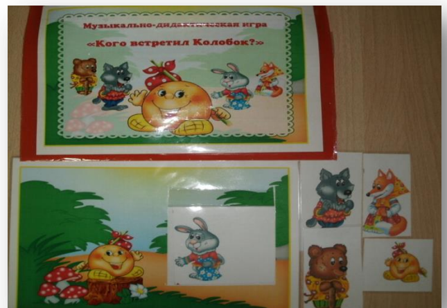
Музыкально-дидактическая игра «Кого встретил колобок?»