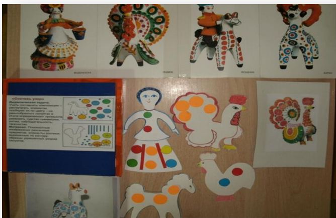
Дидактическая игра по художественно – эстетическому развитию «Составь узор»