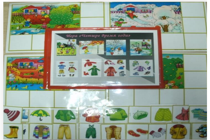
Дидактическая игра «Четыре времени года»