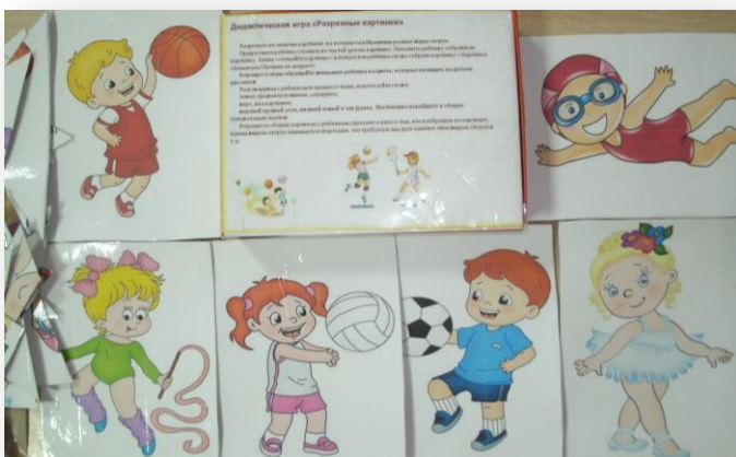
Дидактическая игра по физическому развитию «Разрезные картинки»