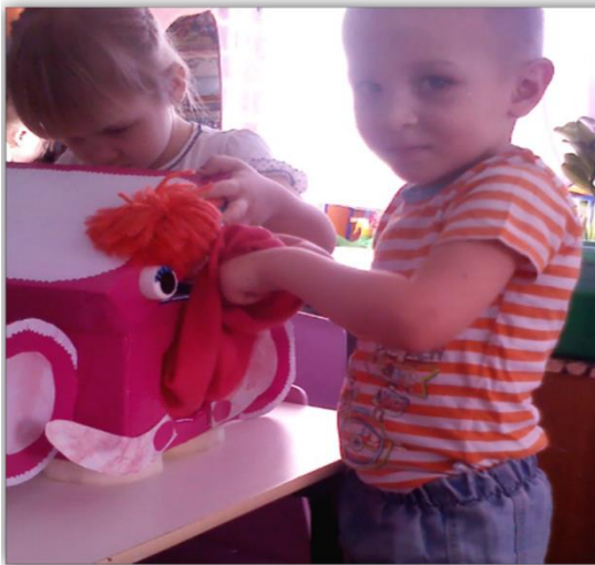
Коммуникативная игра «Давай, подружись»