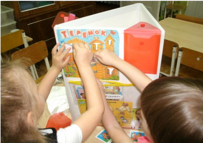
Игра «В гостях у сказки»