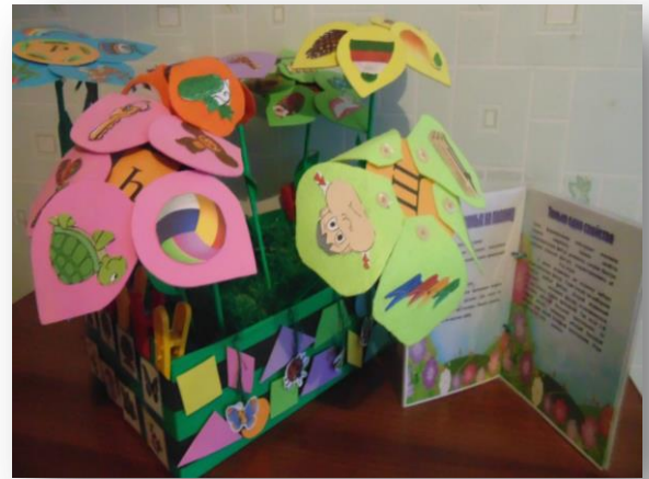
Дидактическая игра «Речевая полянка» используется для коррекции звукопроизношения, развития фонематического восприятия.