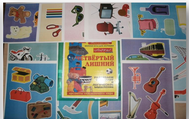
Дидактическая игра по развитию речи и логического мышления «Четвёртый лишний»