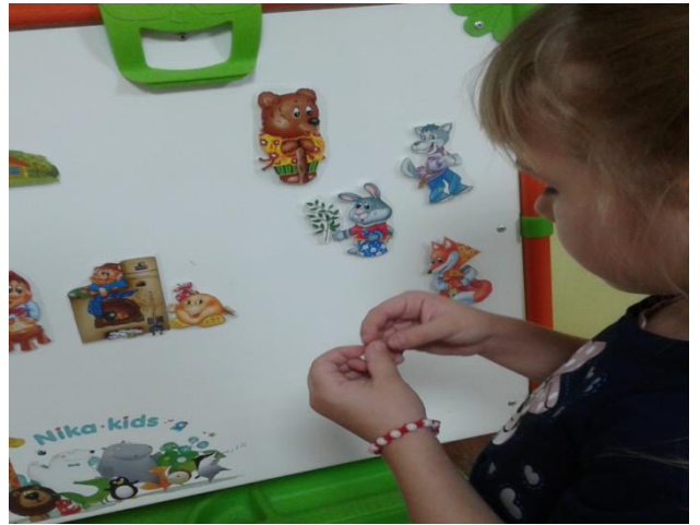
Магнитный театр помогает ребёнку самому составлять мнемотаблицу по сказке