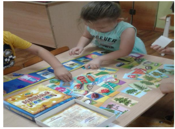
Дидактическая игра «Волшебный пояс». Эта игра учит точно задавать вопросы и развивает умение классифицировать предметы