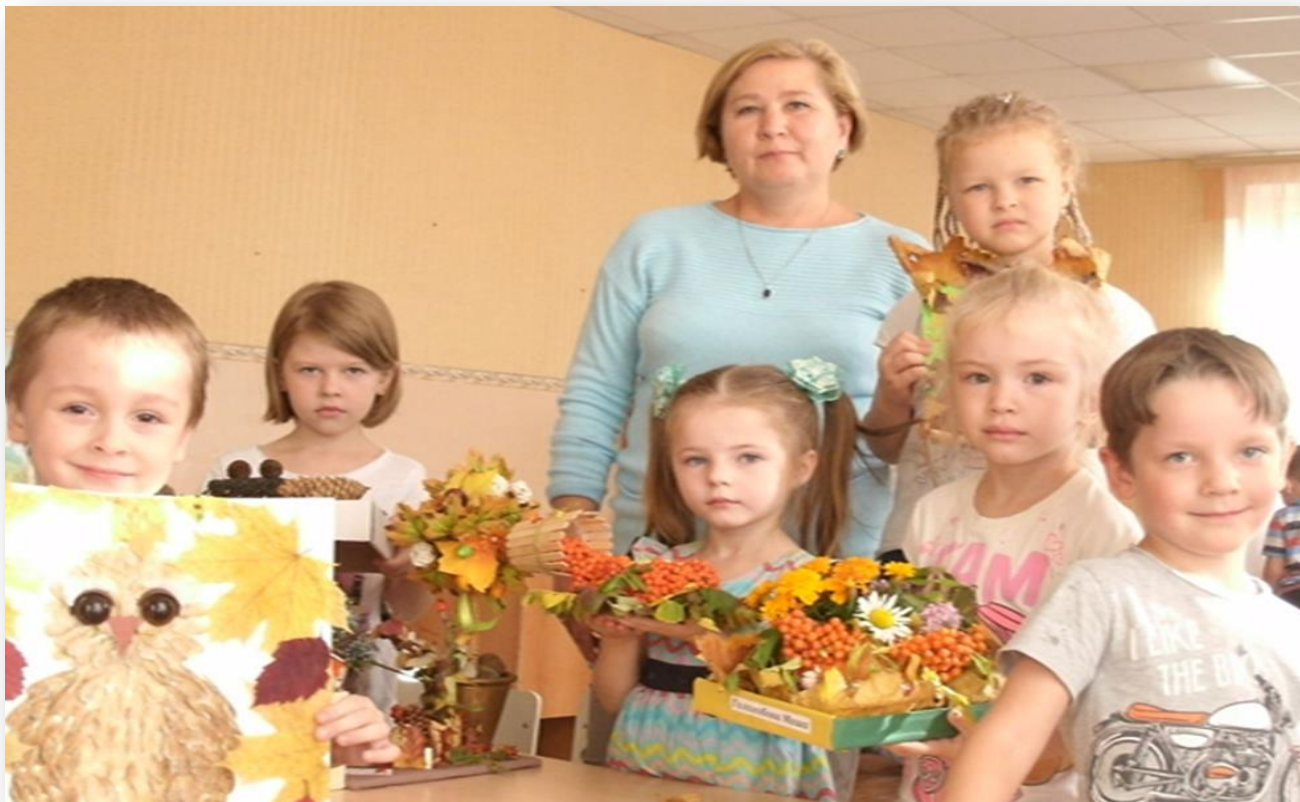
Выставка поделок «Осенняя фантазия»