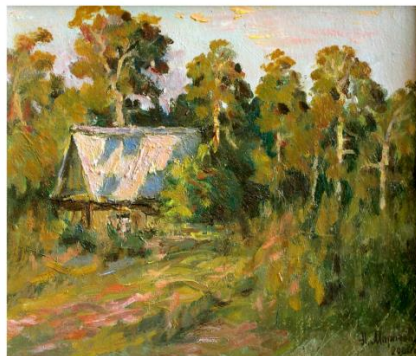
Этюд. 2000г. к.м. 20 x 25.