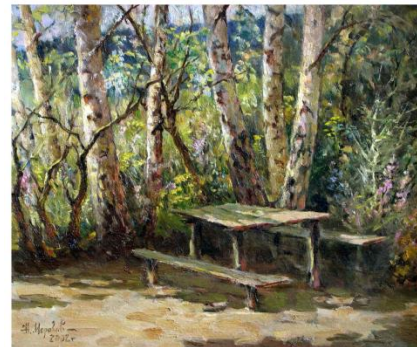
Прелестный уголок 2002г. к.м. 45 x 50.