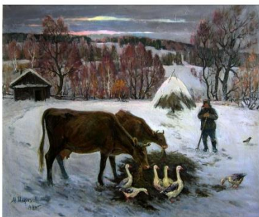
Утро в деревне. 1986. х. м. 100 x 120.

Звание «Почетный гражданин г. Бузулука» было присвоено в 2006 году.