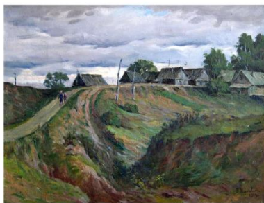
Дорога в деревню. 1989г. х.м. 60 x 80.